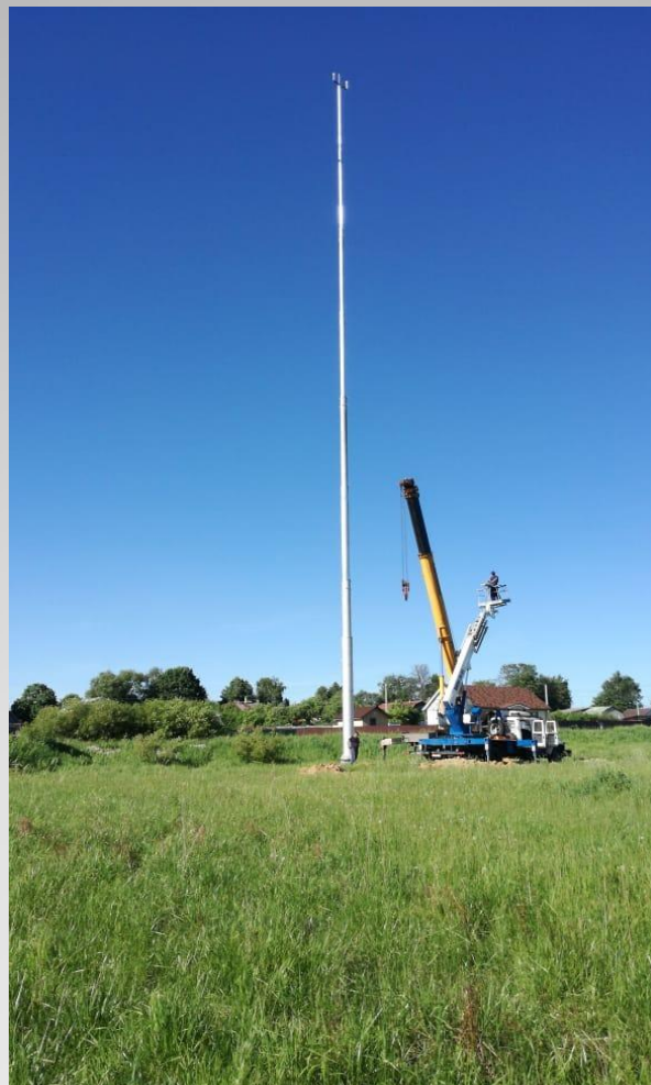
Отдельно стоящие опоры двойного назначения