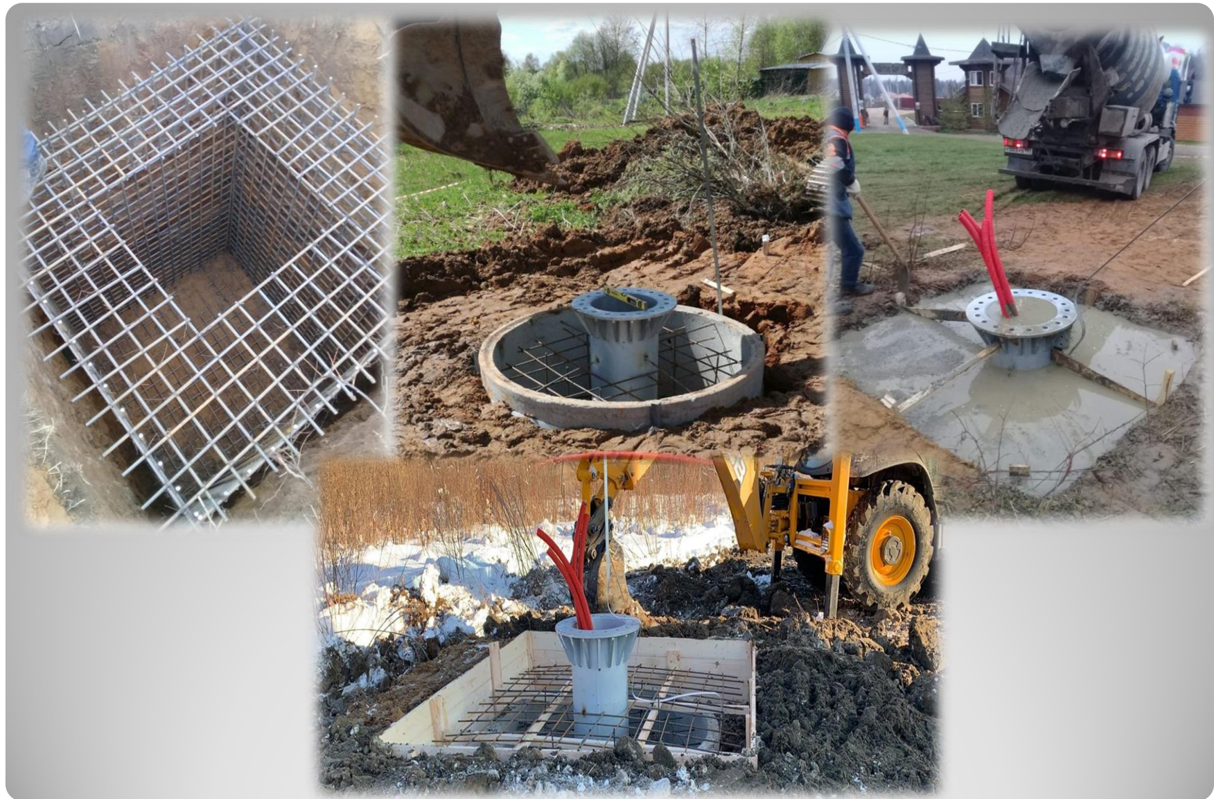
Устройство фундаментов под опоры двойного назначения