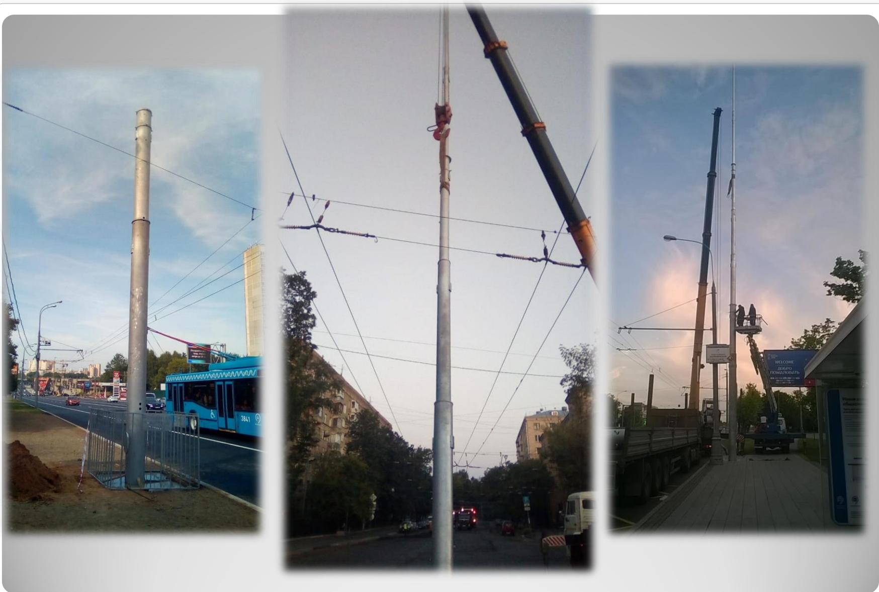
Монтаж опор двойного назначения способных нести нагрузку от контактной сети