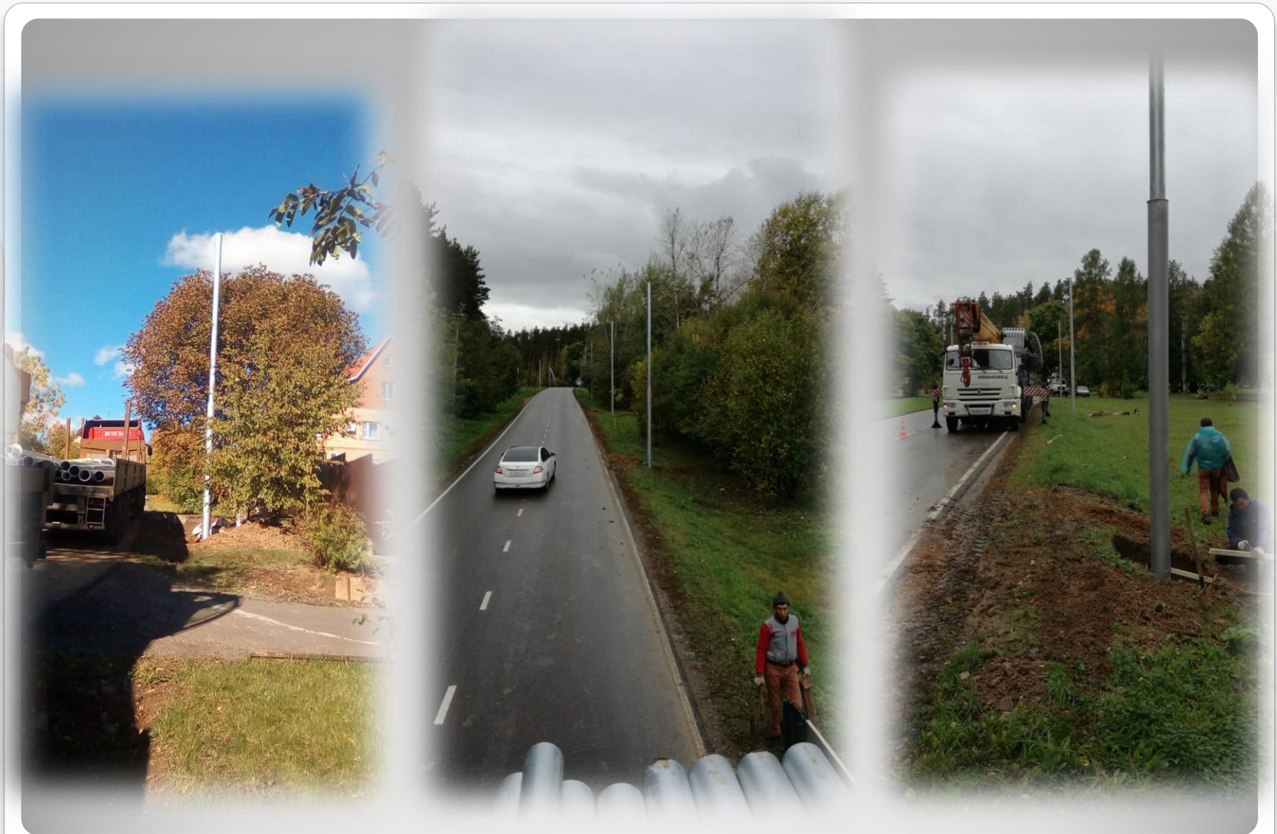
Монтаж опор освещения типа СП с подключением к электропитанию