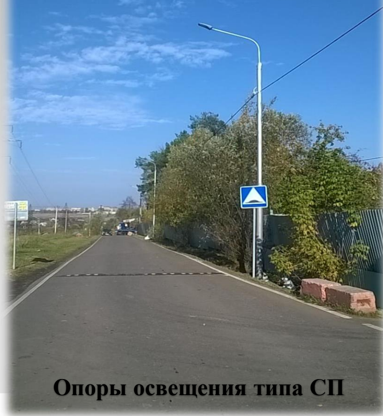
Опоры освещения типа СП