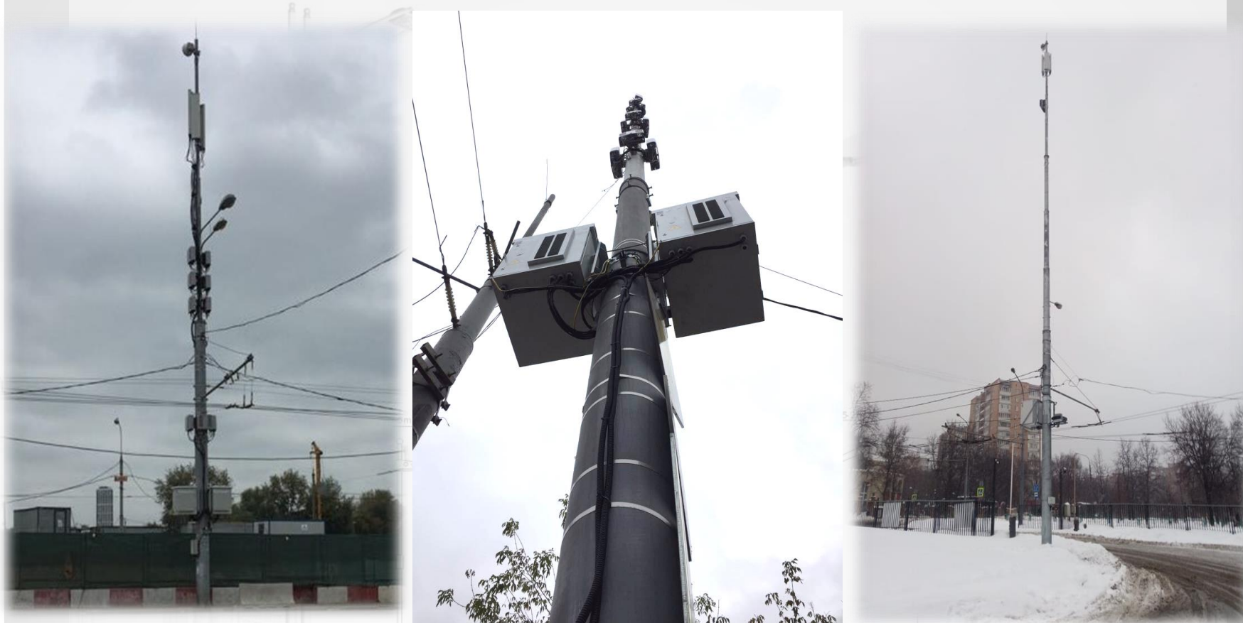
Опоры двойного назначения(ОДН) способные нести нагрузку от контактной сети