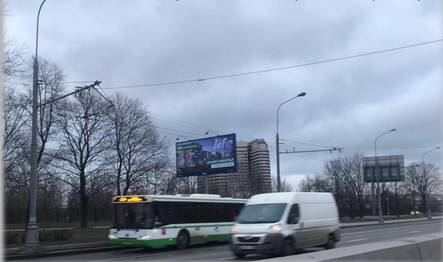
Силовые опоры контактной сети типа ОС